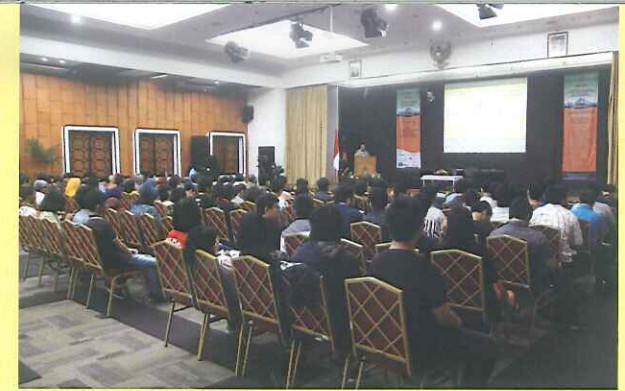
Pelaksanaan Seminar dalam SNHP3M II 2015

"Kolaborasi Pemangku Kepentingan dalam Pemberdayaan Masyarakat untuk Mencapai Kesejahteraan Berkelanjutan (SDGs)"